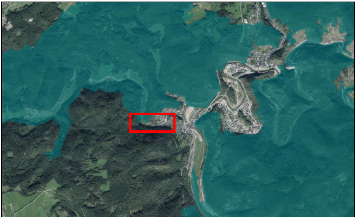
Abb. 1: Lage des Plangebietes (rotes Rechteck) und des VSGs DE 5507-401 „Ahrgebirge“ (blau) (Karte: LANIS RLP)

Aufgabe der vorliegenden Verträglichkeitsvorprüfung ist es, zu prüfen, ob Wirkungen des Vorhabens Erhaltungsziele des betroffenen Natura 2000-Gebietes DE 5507-401 „Ahrgebirge“ beeinträchtigen können.